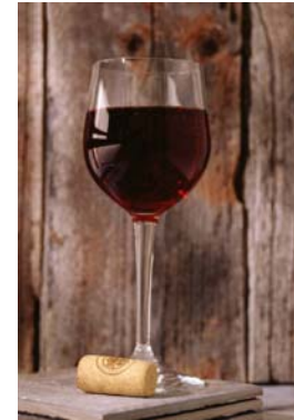
Un bazo de vino de 5 oz.