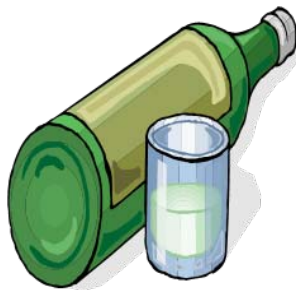
1.5 oz. de 80 prueba de licor