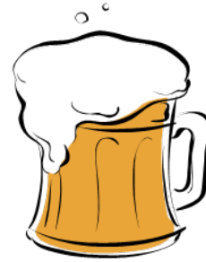
Una Cerveza de 12 oz.